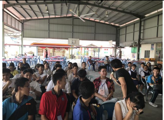
與果園園主談論美羅經濟