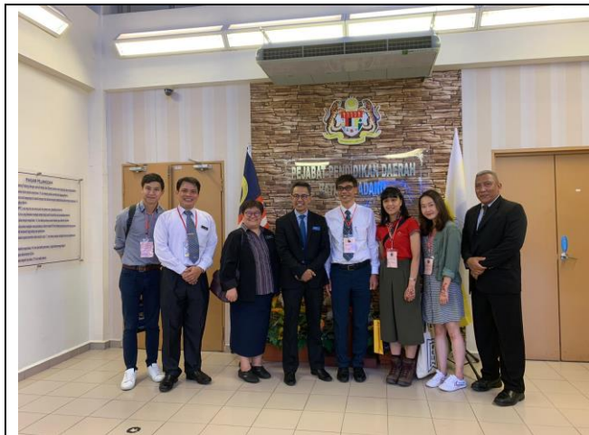
拜訪馬登巴冷縣教育局