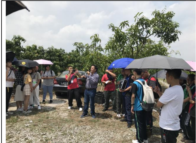
果園園主熱情接待