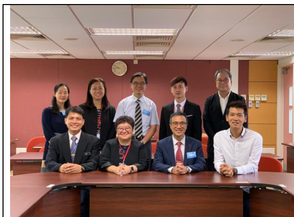
校長老師專業交流

內容介紹:先安排校長老師專業交流，學生分小組進課室體驗上課。然後全校進入禮堂。兩校校長互簽交流紀念書。曾赴馬來西亞考察的學生台上匯報分享。校友曾建中先生主持青年夢想深度交流。友校表演節目。