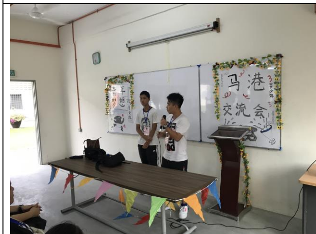
每組匯報討論成果