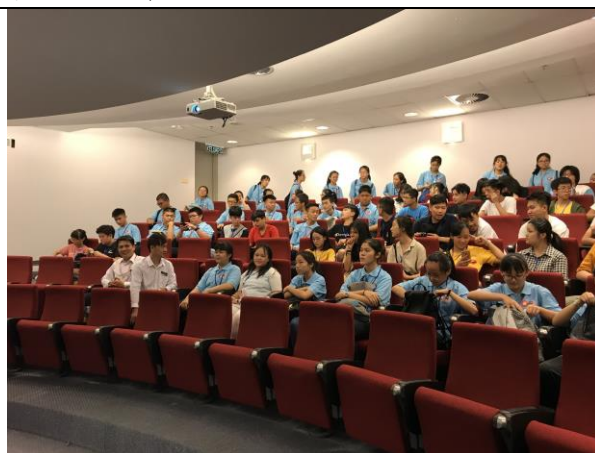
講座：馬來西亞的華文文化承傳