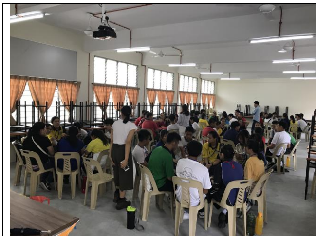
兩校青年分組進行夢想深度交流