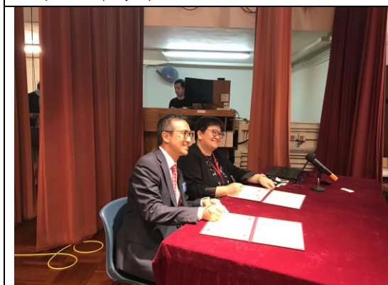
兩校校長互簽交流紀念冊