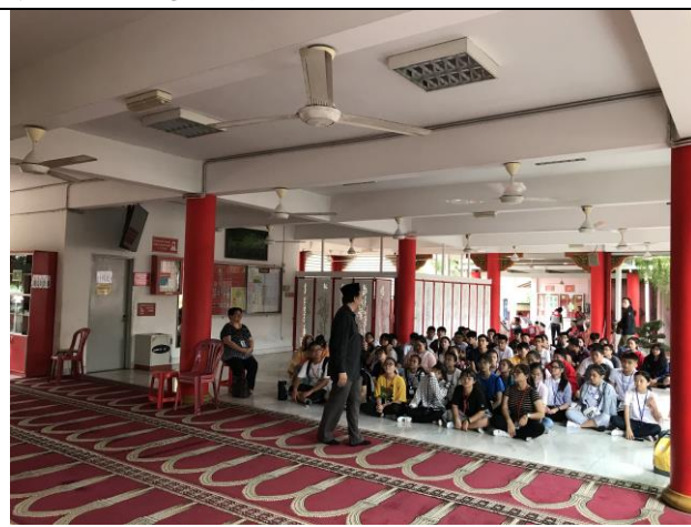
參觀馬來西亞華人清真寺