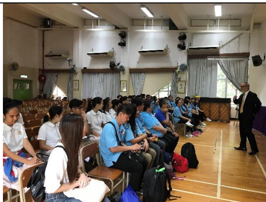
筏可中學勉勵年輕人上進