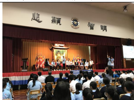
青年夢想深度交流