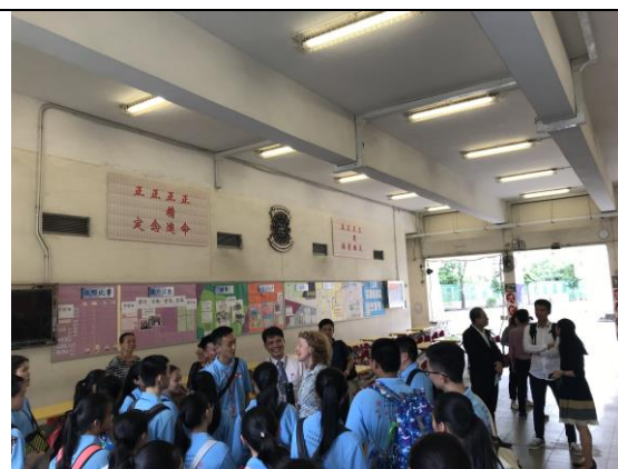
部份學生體驗英語會話課