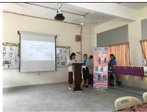
高寶芳老師代表本校致辭