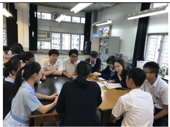
每組由一位老師評分。