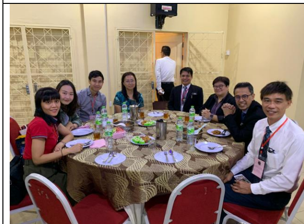
向教育局長了解馬來西亞教育情況