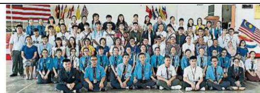
學生交流體驗不同國情 港34師生訪美羅中華華中