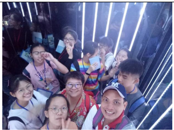
Sky 100 高速升降機