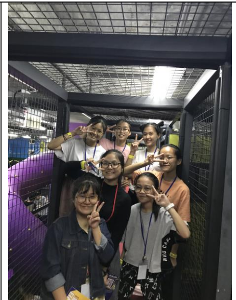
參觀 Super Park