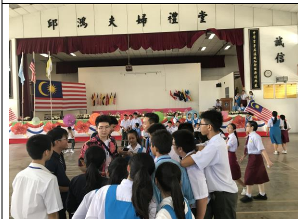
兩校學生交流甚歡