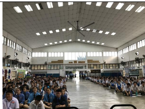
參與馬來西亞國慶典禮