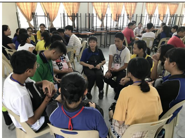
過程認真討論深入