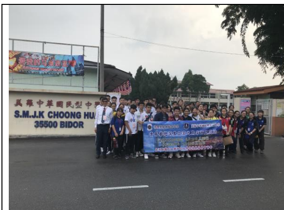
拜訪美羅中華國民型華文中學