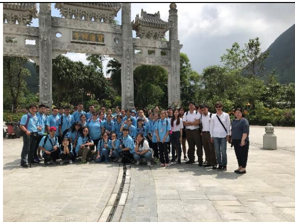
話別前於寶蓮寺三校合照