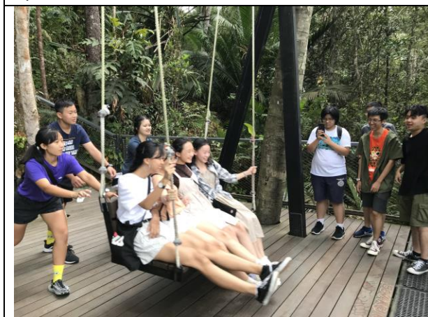
The Habitat 活動情況