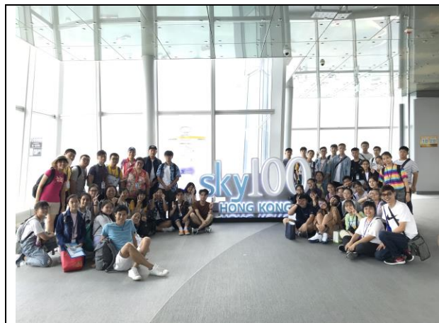
參觀 Sky 100。