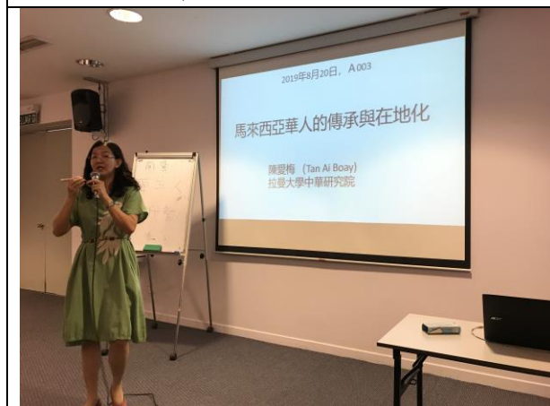
講座：馬來西亞的華文文化承傳