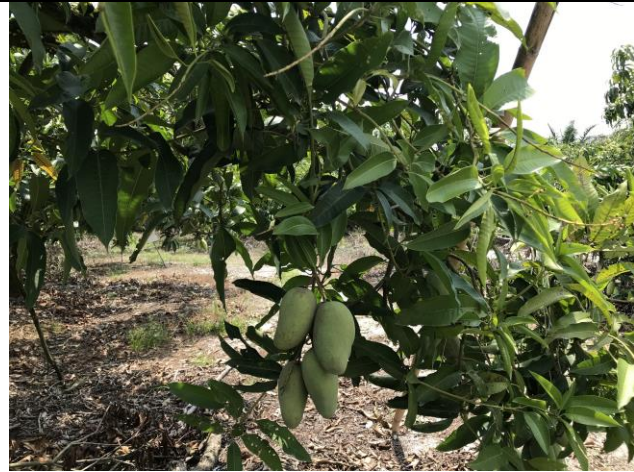
果園園主請我們採摘水果