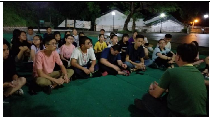
師生夜話於少林寺