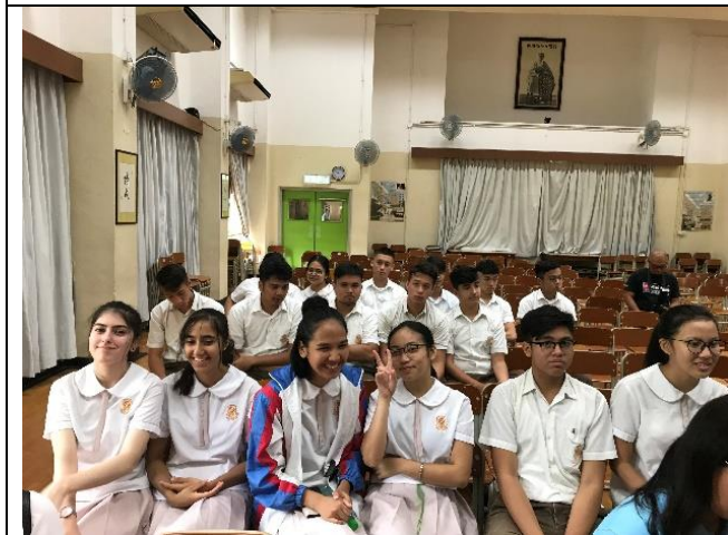
筏可中學外籍學生眾多