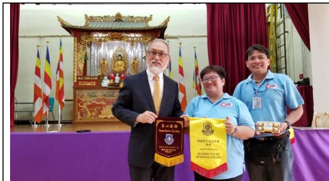
筏可中學與美羅華文中學交換錦旗

內容介紹:筏可中學外籍學生眾多,校方安排印度、巴基斯坦、菲律賓、意大利等學生一起交流。